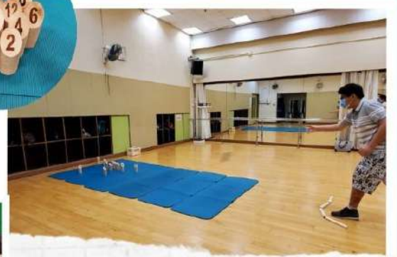
《芬蘭木柱》 唔止有姿勢，仲有實際