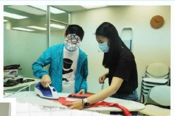
《職場初體驗》 熨衫要變得靚、整齊， 都要經過練習架