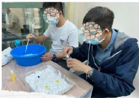
《剃鬚膏鞋》 藝術創品，我得，你都得