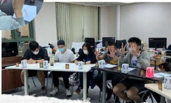
《天希狼人殺》 那怕神一般既對手，只怕🐷一般既隊友