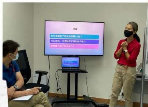
《家長6A小組》 家長們投入聽專業分享， 學習如何發掘子女才能 及建立他們自信心