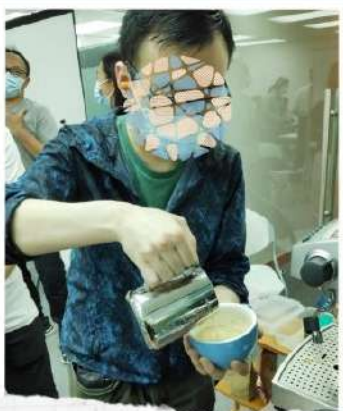
《咖啡拉花》 認真學習，拉花當然無難度