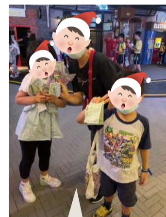
家庭於大富翁主題館「大富翁 夢想世界」內的電子銀行 「執錢」，家長和小朋友都 投入遊戲中，希望一嚐成為 大富翁的滋味。