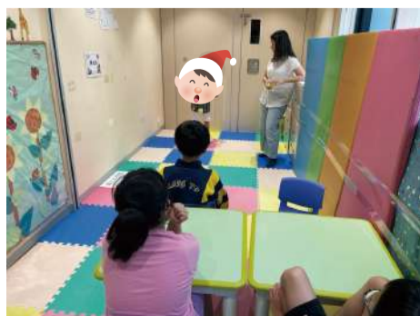
透過職業治療師設計不同活動， 小朋友從中學學習提升專注力。