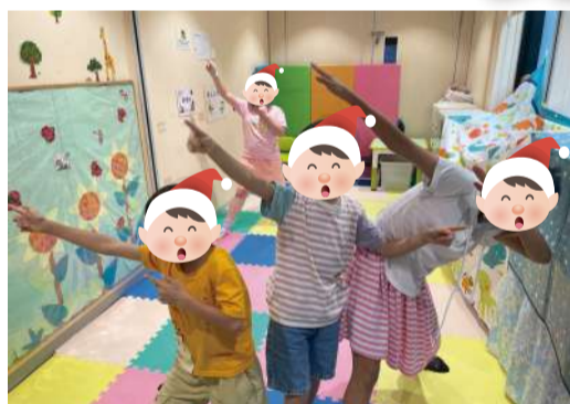
小朋友於小組內學習聽從指令 以完成任務。