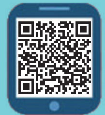
會員及活動報名表