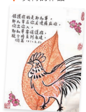
▲ 笑荷達成心願完成人生大事