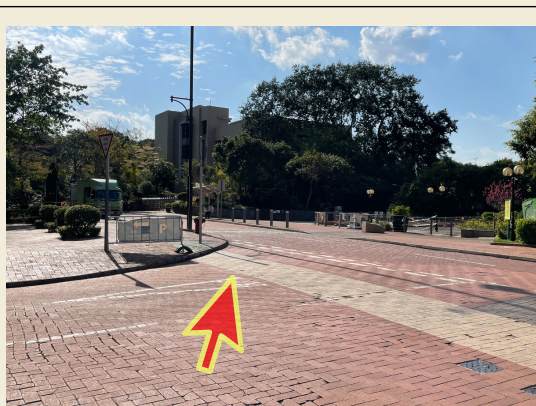
4. 從巴士總站位置橫過馬路。