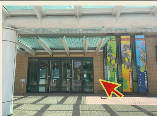
1. 玻璃門進入落扶手電梯