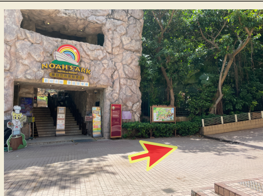
2. 酒店入口前轉右前行，再轉左。