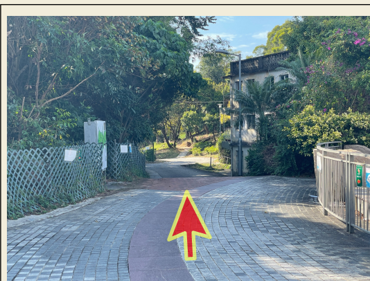
6. 進入小路後，一直往前行。