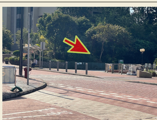
5. 經由小路進入舊村大街。