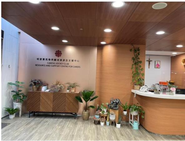
明愛賽馬會照顧者資源及支援中心

享嘉賓，講述不同照顧階段護老者的心聲，以及介紹本會服務，藉此促進專業及跨機構的合作及交流。