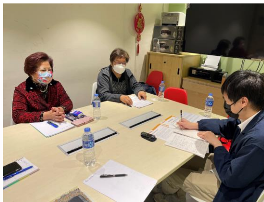
協會幹事進行意見分享

救世軍護老者協會幹事獲嶺南大學亞太老年學研究中心邀請，於 2 月 8 日就護老經歷、照顧者的需要與困難分享意見。協會希望護老者的生命故事與照顧智慧，可以與不同界別多作交流，齊心為照顧者友善社會的願景邁步向前。