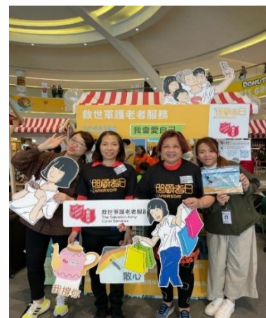
協會幹事及同事打卡影相