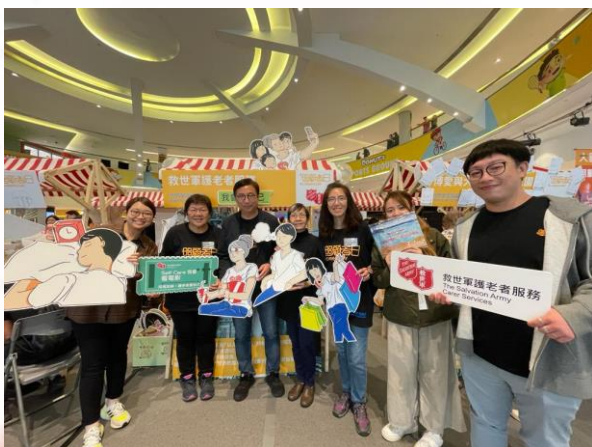
協會幹事及同事與狄志遠議員拍照留念

為響應社會對照顧者的關注，救世軍護老者協會連同多間機構一同參與，由立法會狄志遠議員辦事處主辦的「照顧者日」活動，活動於3月11日在荃灣愉景新城 D·PARK 舉行，場面熱鬧，當中活動包括多位立法會議員和勞工及福利局局長進行對談及講座，以及由不同照顧者團體提供的精彩藝術表演。本護老者協會設立攤位，並由協會幹事向公眾介紹協會資訊及推動護老者「愛自己」訊息，吸引不少參加者和家人踴躍與十個「愛自己」的喘息提示展板打卡影相。