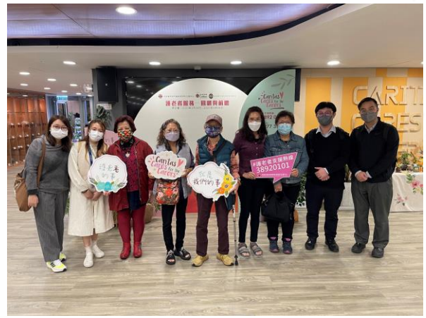
協會幹事及同事於研討會後拍照留念